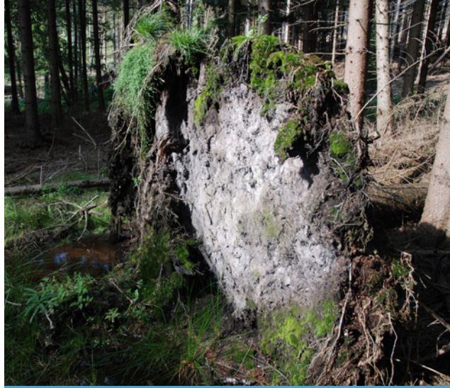
Flacher Wurzelteller einer Fichte nach Windwurf

Gemeinschaftsaktion der Deutschen Bodenkundlichen Gesellschaft (DBG), des Bundesverbandes Boden (BVB), des Ingenieurtechnischen Verbandes für Altlastenmanagement und Flächenrecycling e.V. (ITVA) sowie des Umweltbundesamtes