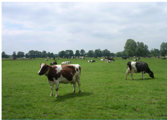
Grünlandnutzung auf Stauwasserboden

Befahren mit Maschinen während der Nassphase zerstört den Bodenaufbau und verdichtet die Böden auf Dauer. Durch Entwässerung geht die Nassphase verloren. Als Folge wird Bodenumus stärker abgebaut, klimaschädliches Kohlendioxid wird freigesetzt und die Erosionsgefahr steigt.