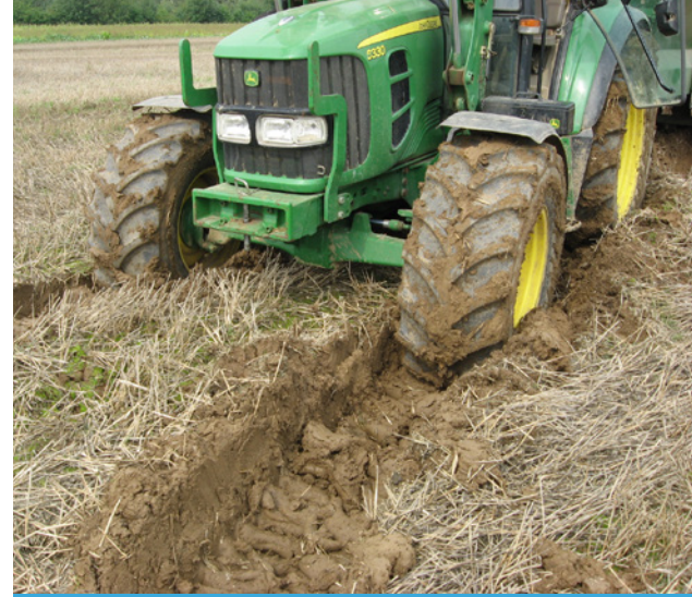
Befahrungsschaden auf einer Ackerfläche