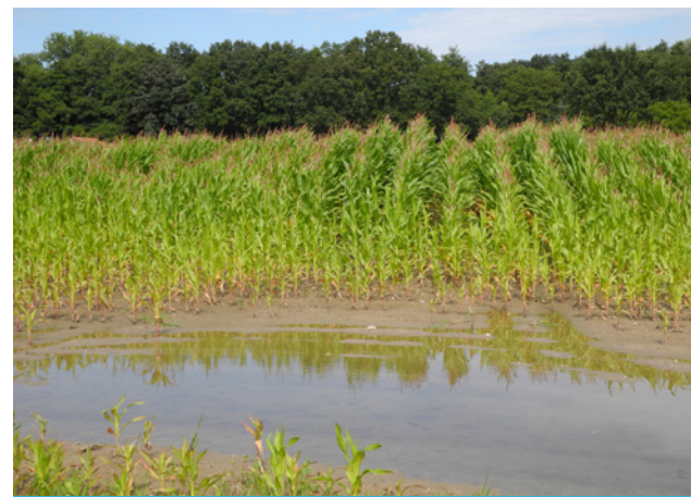
Ertragsausfall auf einem Stauwasserboden

Stauwasserböden sind witterungs- und klimasensibel. Zunehmende Starkregen führen zu häufigeren Nassphasen. Verlängert sich durch Klimaerwärmung die Vegetationszeit, wird der Wasserverbrauch der Pflanzen ansteigen, längere Trockenphasen sind die Folge. Wechselfeuchte Stieleichen-Hainbuchenwälder können sich dann langfristig zu Buchenwäldern entwickeln. In den letzten 50 Jahren hat sich die Vegetationszeit bereits um mehr als zwei Wochen verlängert und die Starkregenereignisse haben zugenommen.