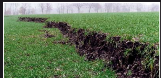
Geländebrüche und Veränderung der Grundwasserstände – Auswirkungen des Bergbaus