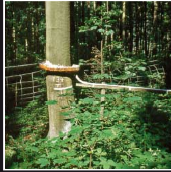
Messung der Schadstoffeinträge in den Waldboden