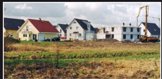
Verlust des Bodens durch Bau von Siedlungen und Straßen

Geologischer Dienst Nordrhein-Westfalen – Landesbetrieb –