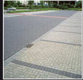
Großflächige Bodenversiegelung auf einem Parkplatz