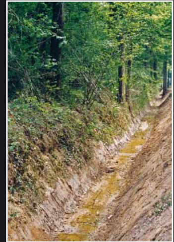
Bodenveränderung durch Entwässerung