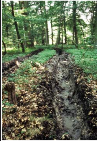
Bodenverdichtung und -zerstörung durch Befahren mit schweren Maschinen