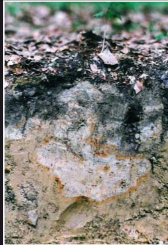
Staunässeerscheinungen (Rostflecken und Bleichung) als Folge von Befahrung im Wald