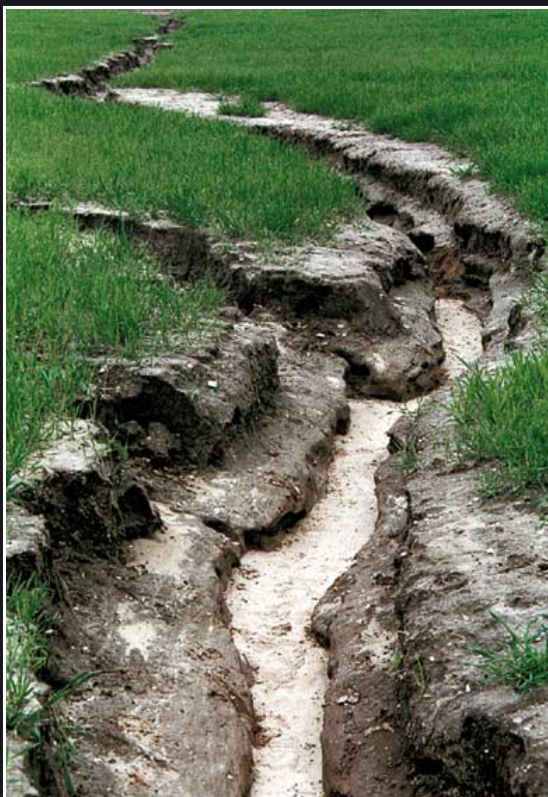
Bodenzerstörung durch grabenförmige Erosion