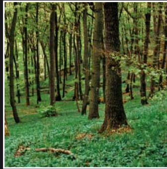
Eichen-Buchenwald mit Bingelkraut auf tiefgründiger Braunerde am Nonnenstromberg