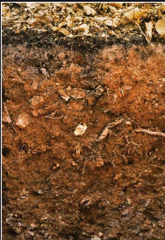
Rötlich gefärbte Braunerde aus Quarzkeratophyr bei Olpe