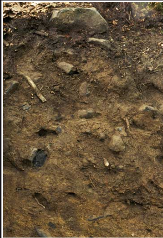
Braunerde aus Basalt-Verwitterungslehm am Großen Stein bei Burbach