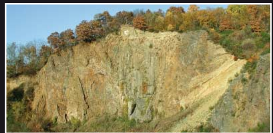
Basaltsteinbruch Dächelsberg bei Niederbachem südlich von Bonn