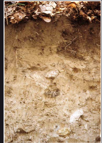
Nährstoffarme Braunerde aus Trachyt am Hohenberg südlich von Bonn