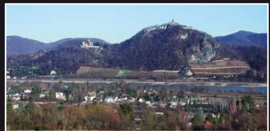
Blick vom Rodderberg auf den Drachenfels