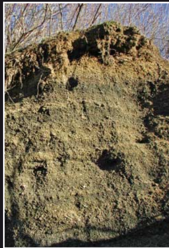
Flach entwickelte Braunerde über Tuff am Rodderberg bei Bad Godesberg