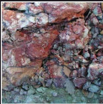
Durch hohe Temperaturen oxidiertes (gefrittetes) toniges Verwitterungsmaterial