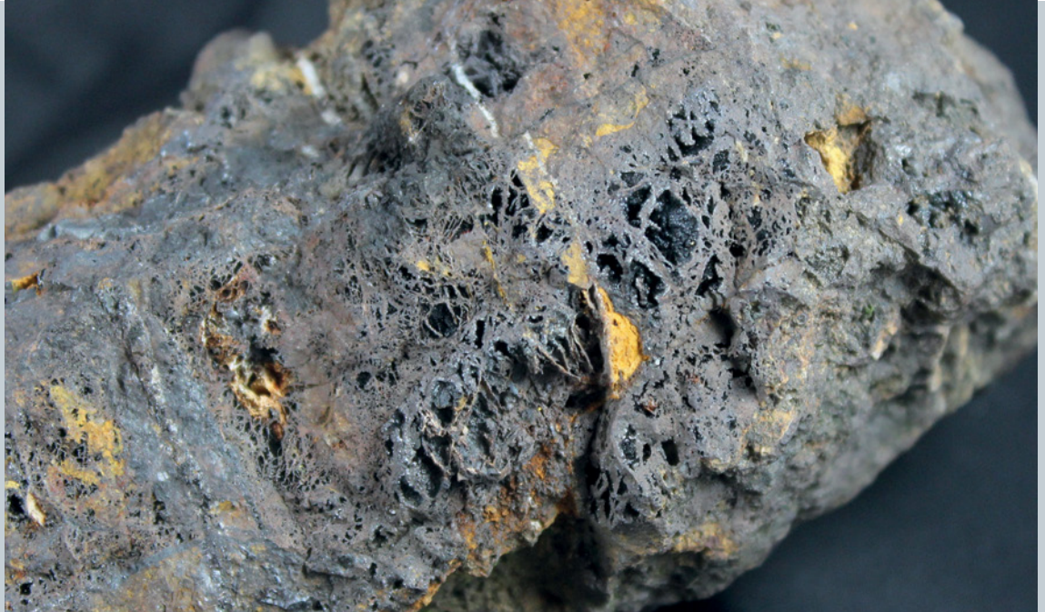
Abb. 2: Brauneisen mit Glaskopfstruktur aus dem Ausgehenden des Siderit-Ganges. Gut erkennbar ist die typische kavernöse Struktur infolge Volumenverminderung bei der Umwandlung des Siderits in Brauneisen (vgl. auch Abb. 6). Bilsteiner Berg, lange Bildkante 6 cm.

Die Gangfüllung besteht in der gesamten streichenden Länge des Ganges darüber hinaus aus (jüngeren) Quarz mit spärlichem Kupferkies. Im Bereich der Siderit-Vererzung, im Südwesten, ist dieser Quarz-Anteil recht gering, nach Nordosten erreicht er bei Hasenhohl mit ca. 0,3 m seine größte Mächtigkeit, um schließlich bei Oberbauer-Kerkenberg, etwa im Bereich der Landesstraße L 701 Breckerfeld – Ennepetal-Voerde, auszuweichen (vgl. Abb. 1). Als Sekundärbildung aus Kupferkies tritt hier selten Tenorit (CuO) auf, andere Kupfer-Sekundärminerale waren nicht nachzuweisen.