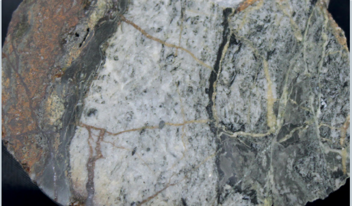
Abb. 3: Weißgrauer Ankerit, mit vielen Nebengesteinseinschlüssen und stark mit Tonschiefer verwachsen, sowie jüngerer, hell- bis dunkelbrauner Siderit; Bilsteiner Berg, polierter Anschliff, lange Bildkante 6 cm

Der im Bilsteiner Erzgang mengenmäßig vorherrschende grobkörnige Siderit ist jünger als der Ankerit. Er besteht aus hypidiomorphen Kristalliten mit Korngrößen von 1 – 5 mm. Seine Färbung ist gelb bis hellbräunlich, durch oberflächennahe Oxidation auch dunkelbraun. Mit bloßem Auge erkennt man bereits eine rhomboedrisch-spätige Struktur, die mit dem sogenannten „spangeligen“ Siderit des Siegerlandes (FENCHEL et al. 1985: 79) vergleichbar ist. Neben zahlreichen Bruchstücken des Nebengesteins enthält dieser Siderit relativ häufig Diabas-Bruchstücke, die – wie zum Teil auch der Siderit – brekziiert bis mylonitisiert sind (Abb. 4). Die Diabas-Klasten zeigen keine wesentliche Veränderung durch die Siderit liefernden Hydrothermen. Der derbe Siderit führt darüber hinaus vereinzelt kleine Sulfidfunken aus Pyrit und Kupferkies bis maximal 2 mm Größe. In durchbewegten Scherzonen des Siderits ist Kupferkies etwas häufiger anzutreffen, sodass die Kupferkies-Abscheidung die Siderit-Mineralisation überdauert hat.