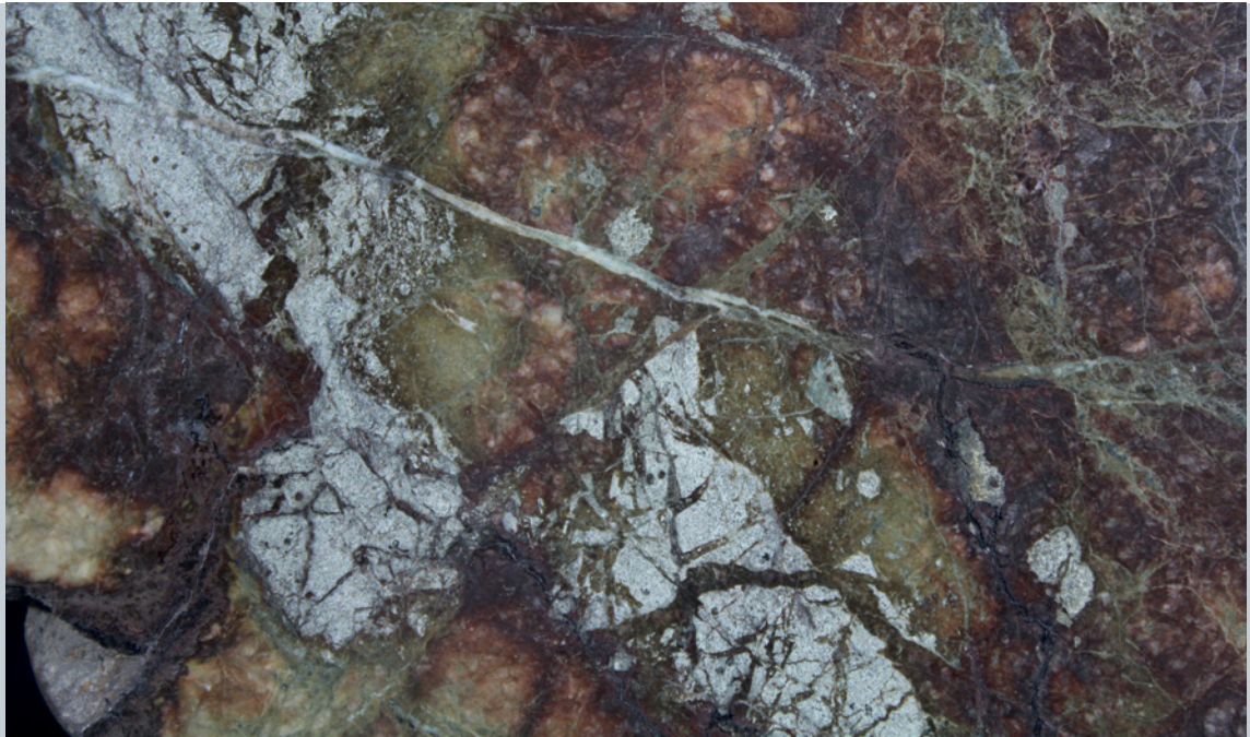
Abb. 4: Siderit I, derb, grobkörnig, hell- bis dunkelbraun, mit Diabas-Bruchstücken (Feldspatleisten gerade noch erkennbar) und jüngeren weißen Quarz-Gängchen (diagonal verlaufend); Bilsteiner Berg, polierter Anschliff, lange Bildkante 3 cm

Analysen der Bilsteiner Karbonate ergaben die folgenden Metall- und SiO 2 -Gehalte: