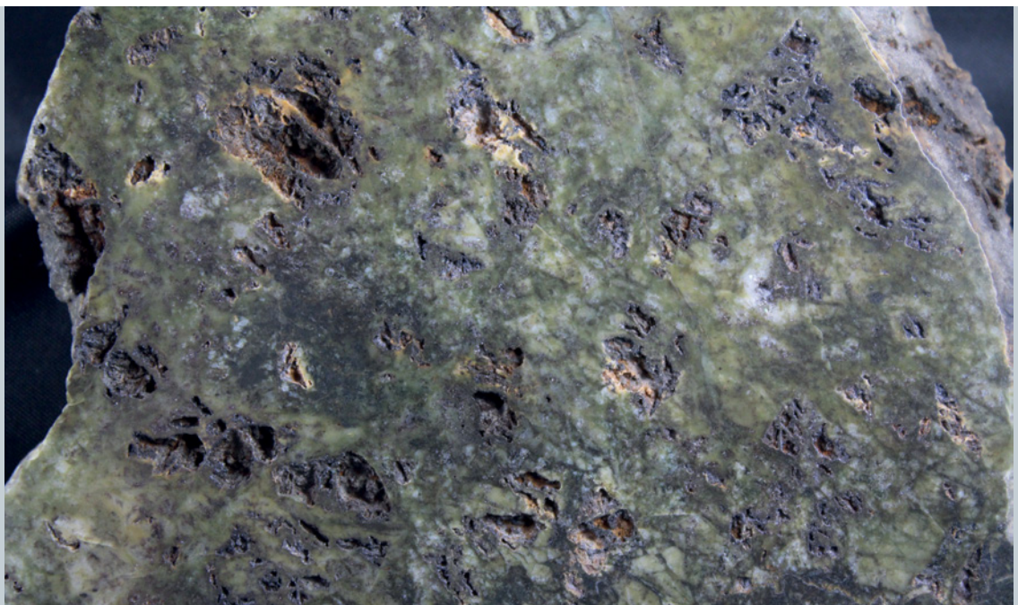
Abb. 6: Idiomorphe rhomboedrische Siderit-Kristalle (Siderit II) in verschiedenen Schnittlagen, in Brauneisen umgewandelt; der umgebende jüngere feinkörnige, grünlich graue Quarz ist hier in sich wiederum brekziiert und besteht aus mehreren Teilphasen; Bilsteiner Berg, polierter Anschlag, lange Bildkante 3 cm